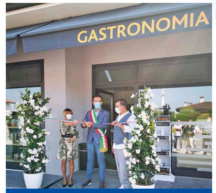
Inaugurazione gastronomia Rio Gustoso