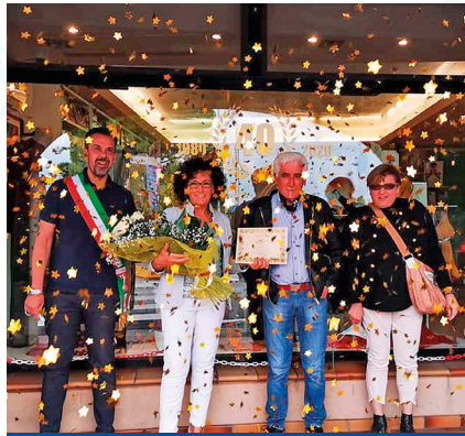
40 anni Lady Marnia