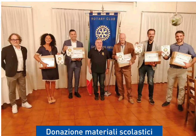
Donazione materiali scolastici Rotary Castelfranco Asolo