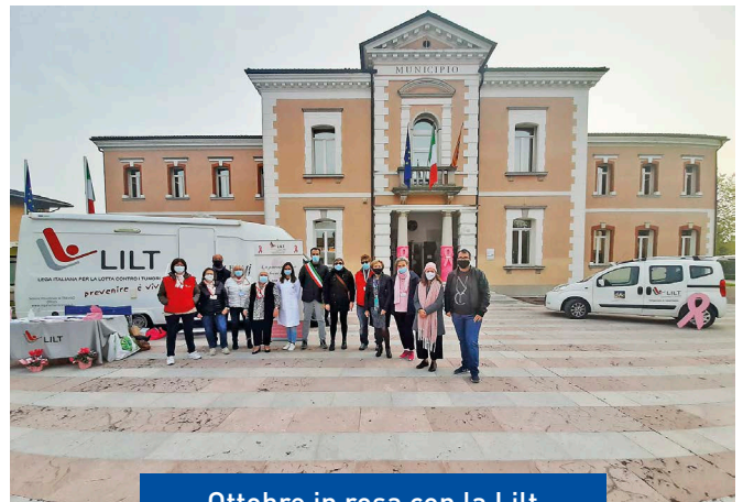
Ottobre in rosa con la Lilt