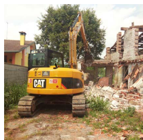
Demolizioni in genere