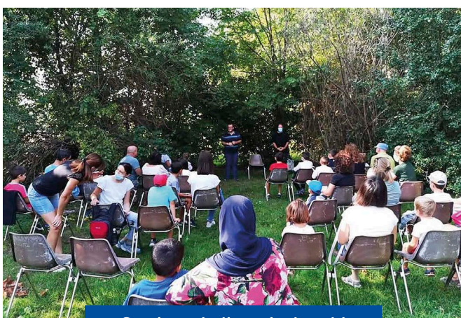
Storie a piedi corti e lunghi