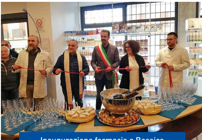
Inaugurazione farmacia a Bessica