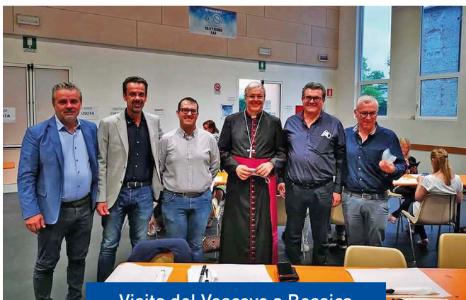
Visita del Vescovo a Bessica