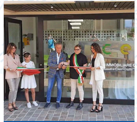
Nuovo ufficio Agenzia Caon