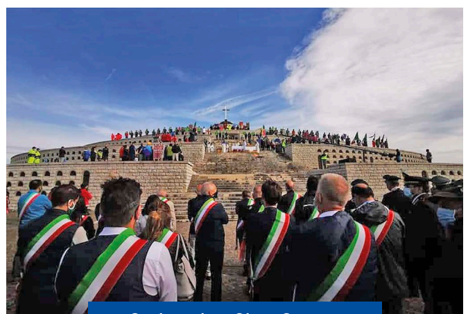
Cerimonia a Cima Grappa