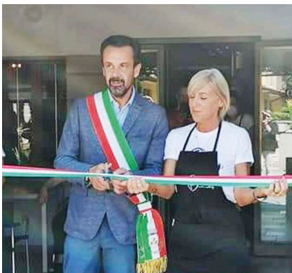
Inaugurazione Bar Bi