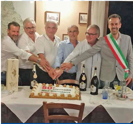
50 anni Selle Montegrappa