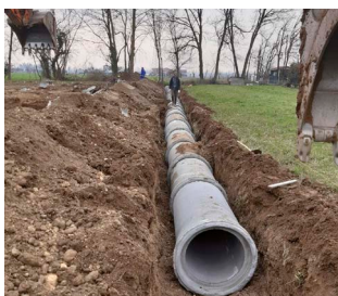
Posa tubazioni di qualsiasi diametro